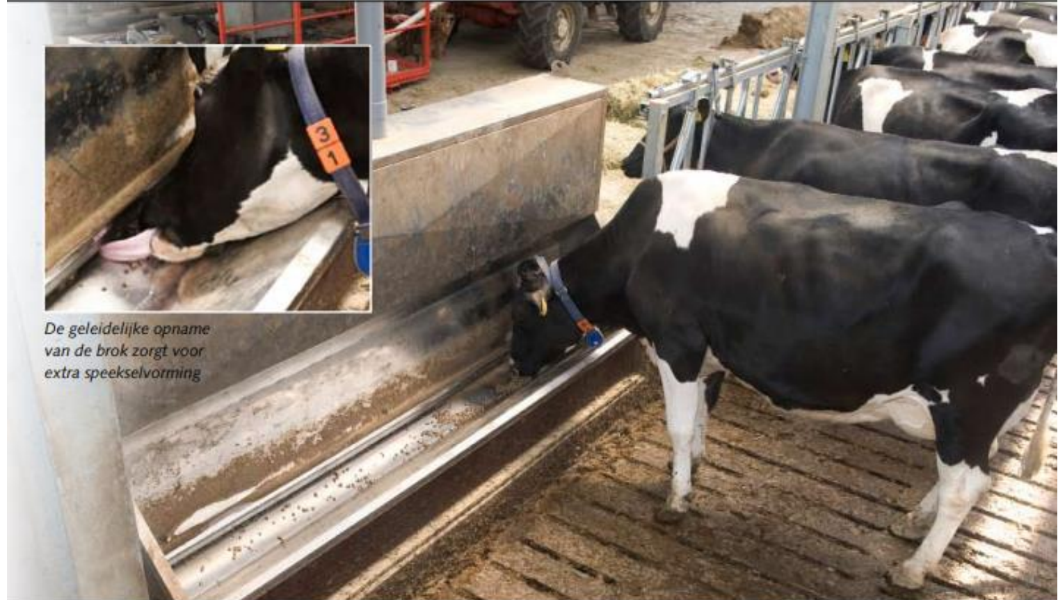
De geleidelijke opname van de brok zorgt voor extra speekselvorming

evalligerwijs de naastgelegen onder- lderde sleufsilos gebruiken als onder- ruw voor de ligboxenstal, die maximaal n 110 melkkoeien plaats kan bieden. 1 nog bezet het jongvee een deel van recent onregelverde stabuitbreiding en